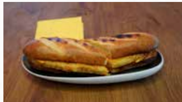
Classic Poulet-Schnitzel 8.00