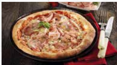
Holzofen-Pizza Prosciutto 13.00

Im Holzofen vorgebackene Pizza mit Tomatensauce, Mozzarella und würzigem Schinken.