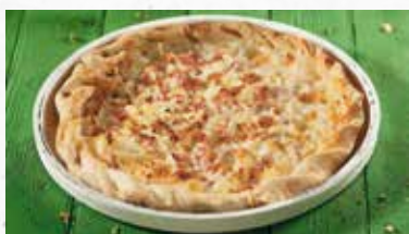
Elsässer Flammkuchen 8.50

Belegt mit Crème fraîche, Zwiebeln und Speck. Ø 24 cm