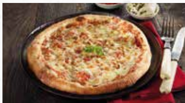
Holzofen-Pizza Margherita 12.00

Im Holzofen vorgebackene Pizza mit Tomatensauce und Mozzarella.