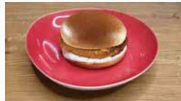
Crispy Chicken Burger 8.00

Chickenburger mit Brioche Bun und Sauce nach Wahl. (Fleischherkunft: CH)