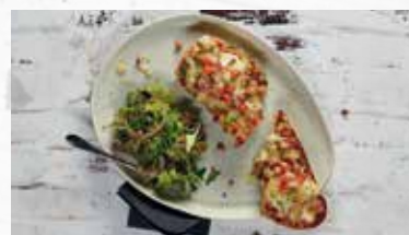
Zwirbelbrot-Snack Prosciutto 6.50

Weizenbrötli belegt mit Zwiebeln, geräuchertem Schinken und Käse.