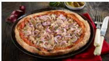
Holzofen-Pizza MSC Tonno Cipolle 13.00

Im Holzofen vorgebackene Pizza mit Tomatensauce, Thon, roten Zwiebeln, Kapern und Mozzarella.